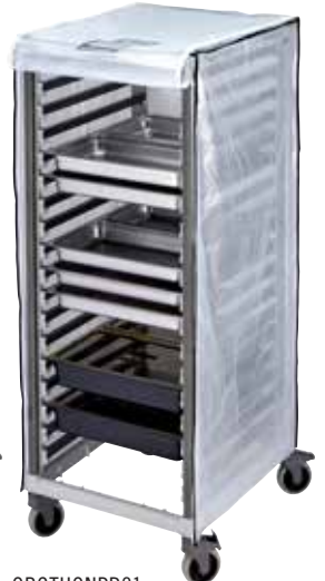
GBCTUGNPR21 Cubierta de vinilo resistente opcional para el carro GN 2/1 alto.